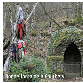
Bonne fontaine à Courbefy

Situé au pied du massif boisé de Courbefy, le village de Saint-Nicolas-de-Courbefy, présente plusieurs intérêts : l'église du XIIème siècle avec ses contreforts romans, une corniche massive en granit sculptée et ses fenêtres en plein cintre. Certains éléments du cimetière, sarcophages et pierres tombales, ont été réemployés comme bordure du chemin d'accès.