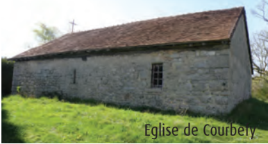
Eglise de Courbey

A la période gauloise, un oppidum aurait été aménagé sur le site de Courbefy, et au moins 2 forteresses successives ont été édifiées. Il reste aujourd'hui une motte cernée de 2 fossés.