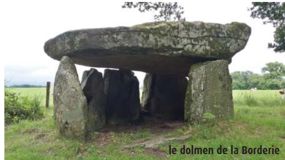
le dolmen de la Borderie

L'installation humaine au néolithique est attestée par différents ensembles mégalithiques, comme le dolmen de la Borderie à Berneuil (-2 650 av. J.-C.) et le mobilier funéraire trouvé avec, attestant du commerce (flèches, coquillages, parures...).