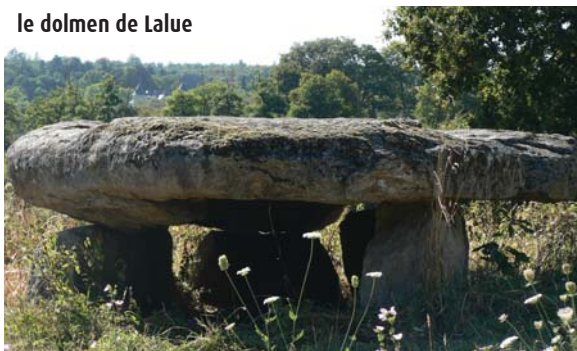
le dolmen de Lalue

L'installation humaine au néolithique est attestée par différents ensembles mégalithiques, comme le dolmen de la Borderie à Berneuil (-2 650 av. J.-C.) et le mobilier funéraire trouvé avec, attestant du commerce (flèches, coquillages, parures...).