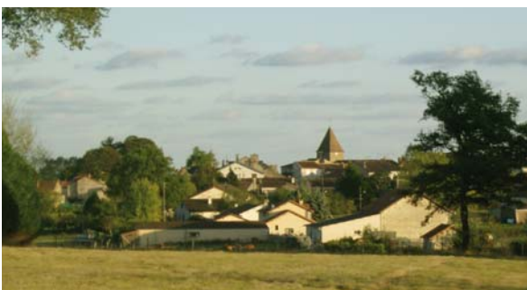
Bourg de Bussière-Poitevine